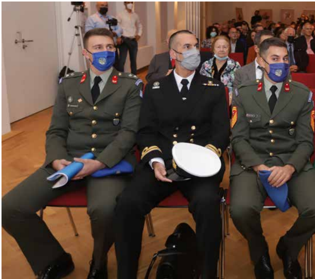
Βραδιά φιλελλήνων γερμάνων Kursaal Bad Cannstatt - Stuttgart