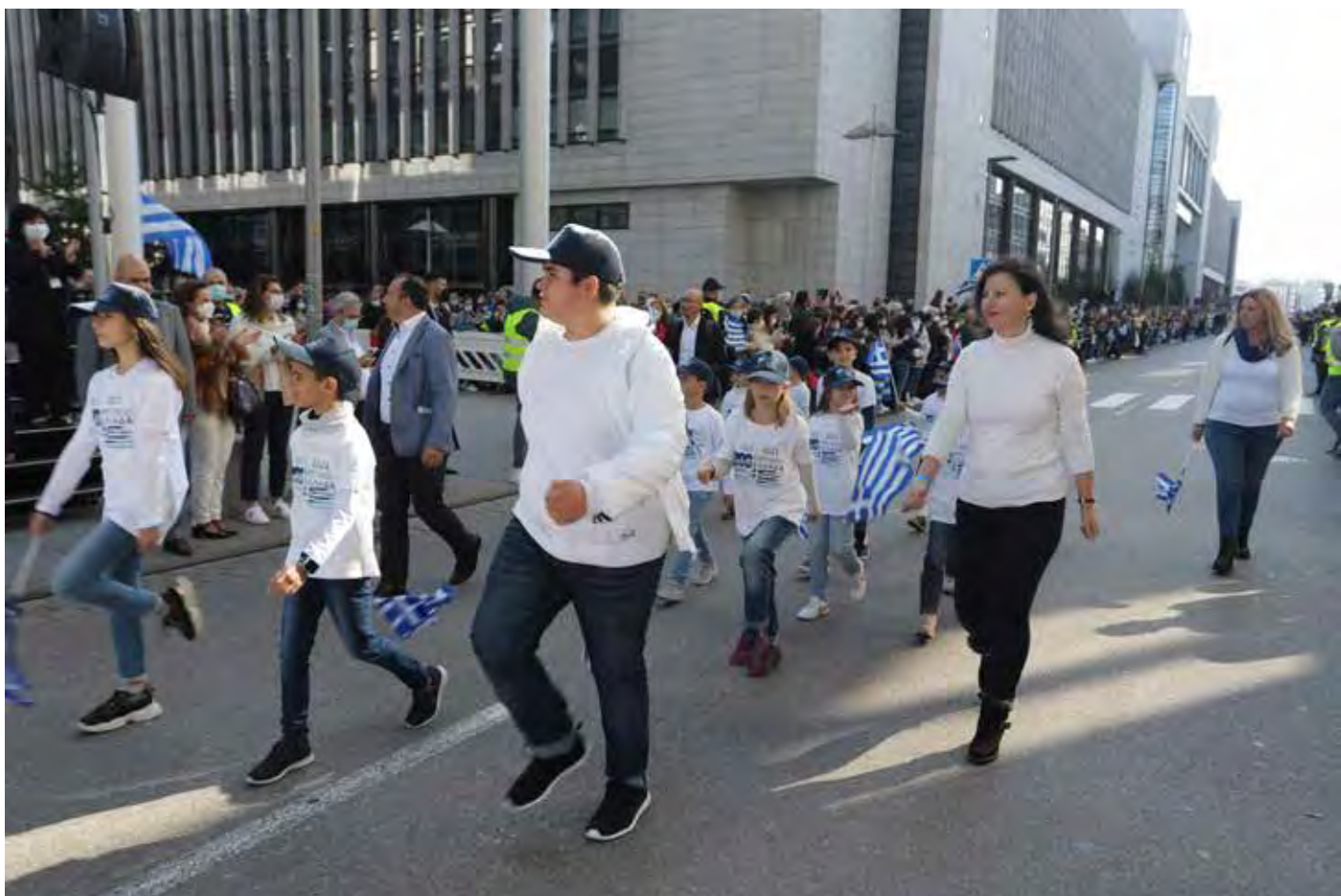
Παρέλαση Στουτγάρδης Σάββατο 9 Οκτωβρίου 2021