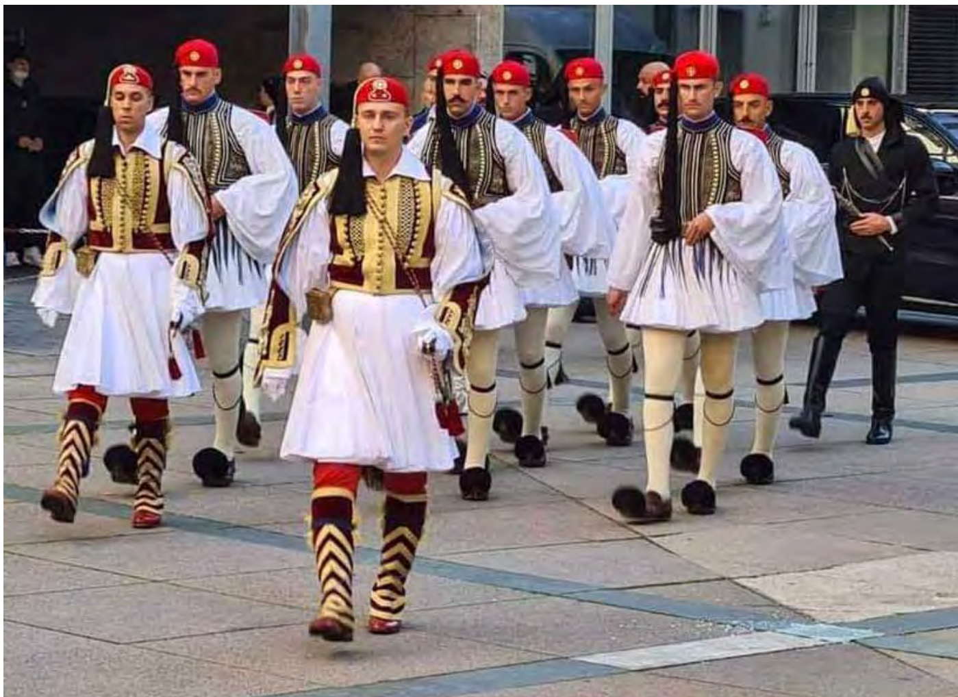
Παρέλαση Στουτγάρδης Σάββατο 9 Οκτωβρίου 2021