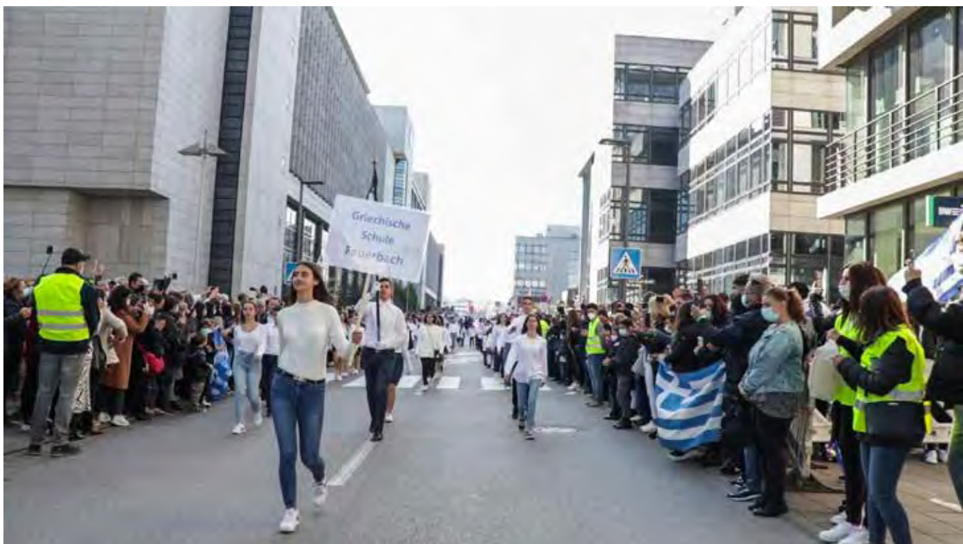
Παρέλαση Στουτγάρδης Σάββατο 9 Οκτωβρίου 2021