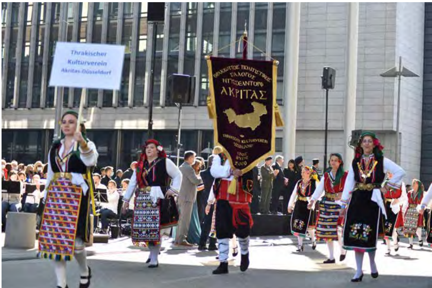
Παρέλαση Στουτγάρδης Σάββατο 9 Οκτωβρίου 2021