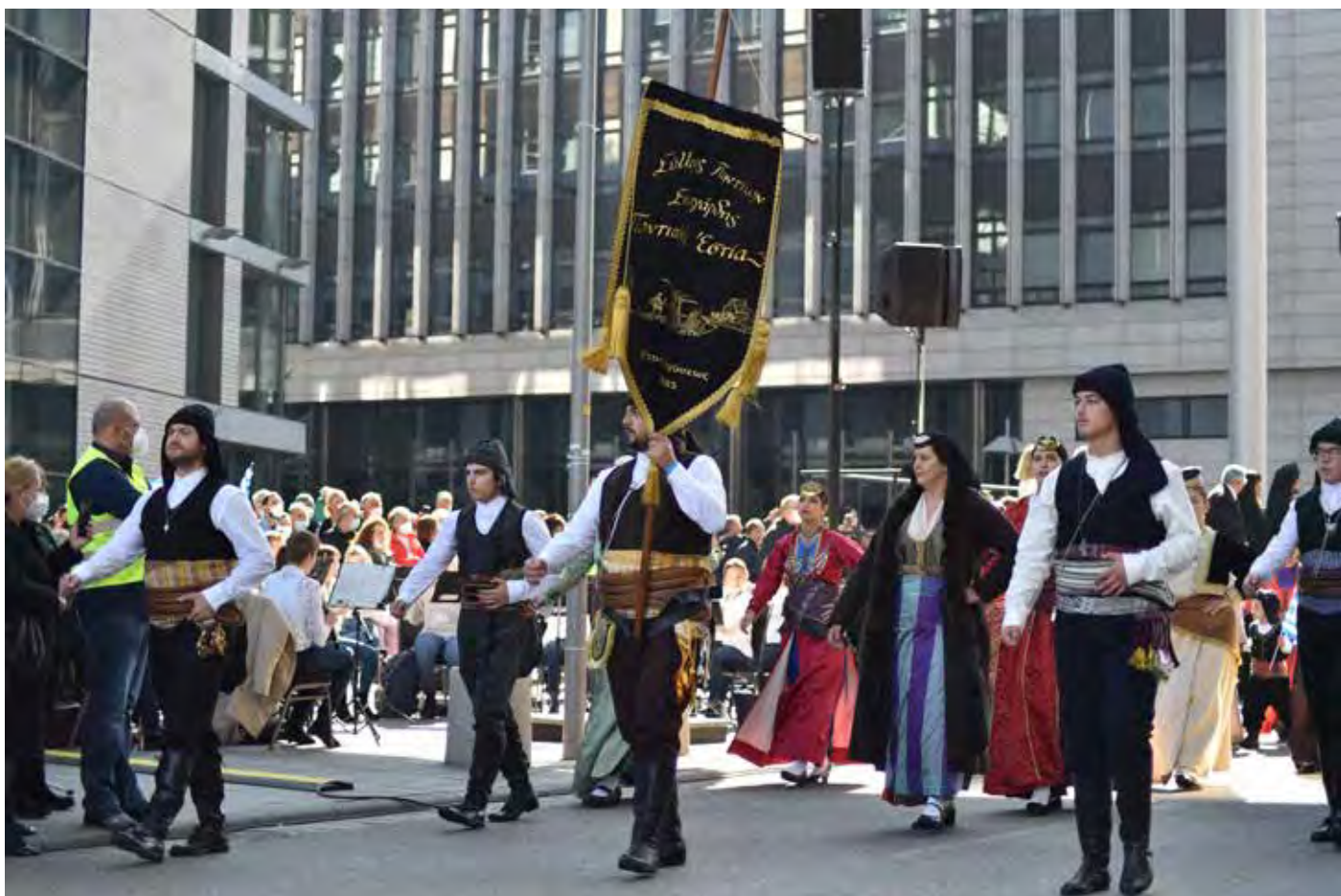
Παρέλαση Σουτγάρδης Σάββατο 9 Οκτωβρίου 2021