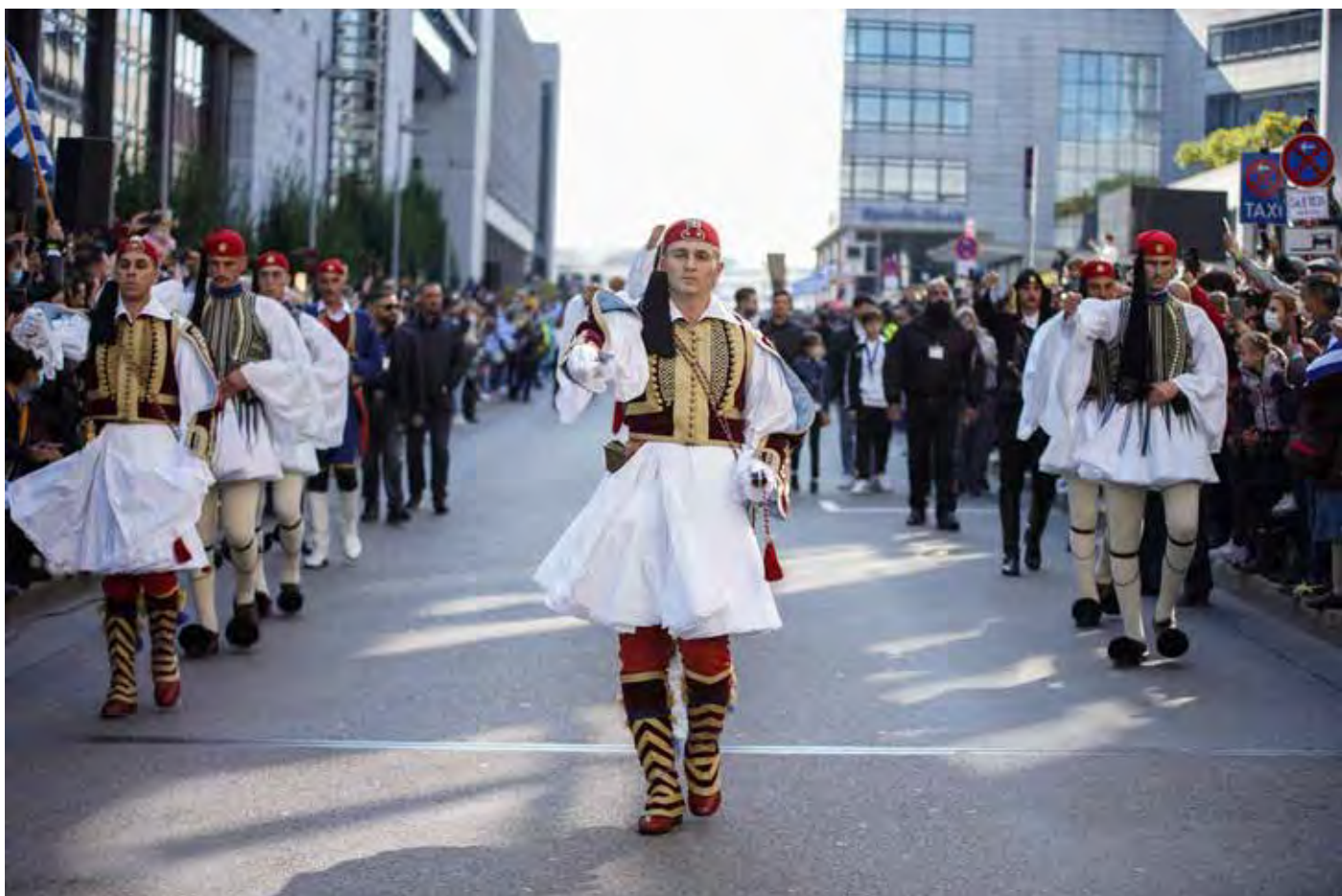
Παρέλαση Στουτγάρδης Σάββατο 9 Οκτωβρίου 2021