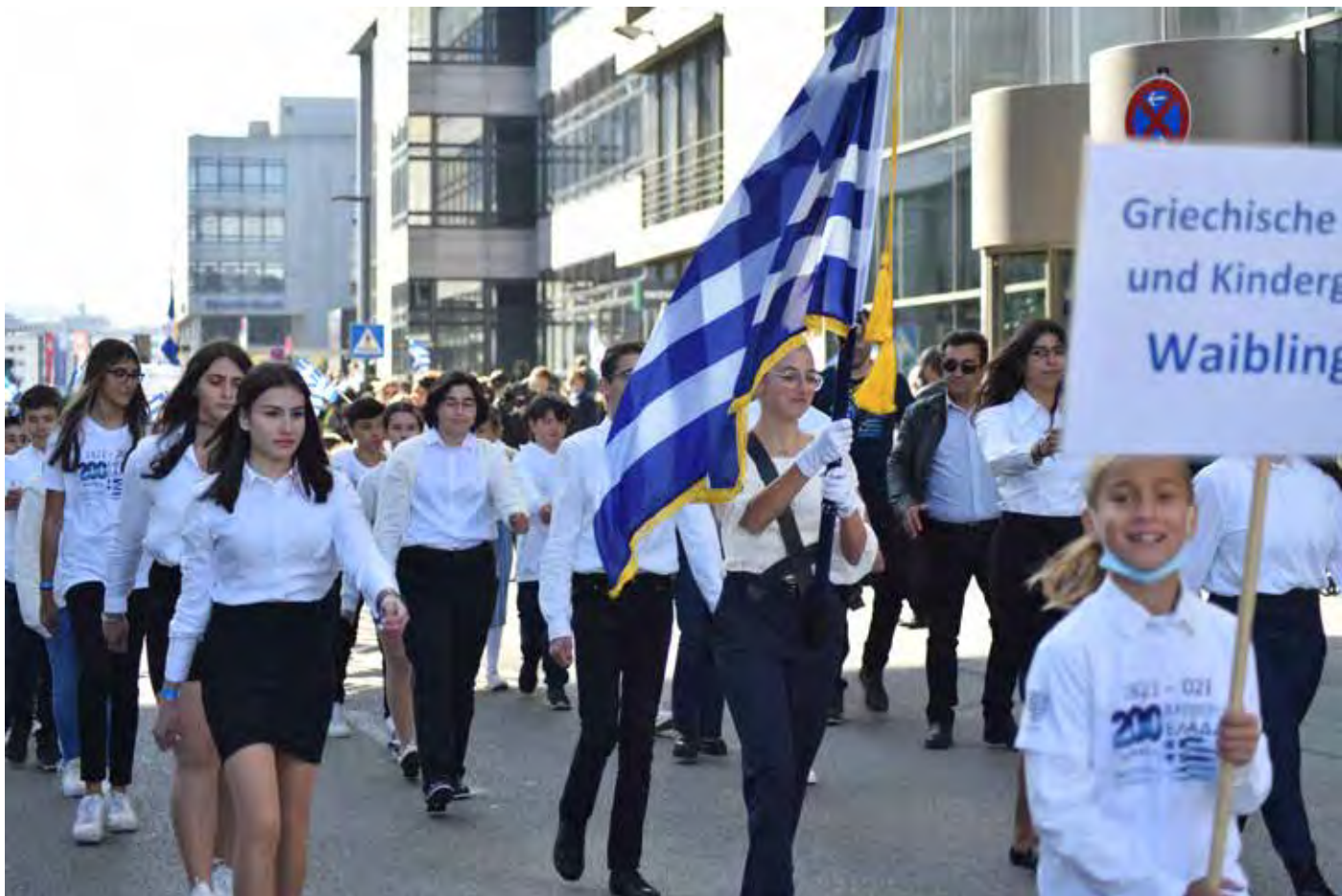
Παρέλαση Στουτγάρδης Σάββατο 9 Οκτωβρίου 2021