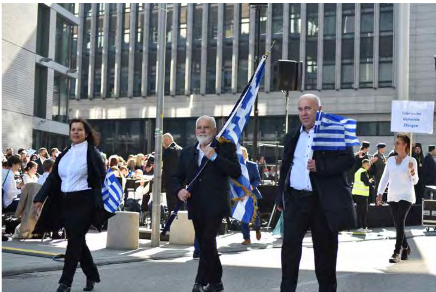
Παρέλαση Στουτγάρδης Σάββατο 9 Οκτωβρίου 2021