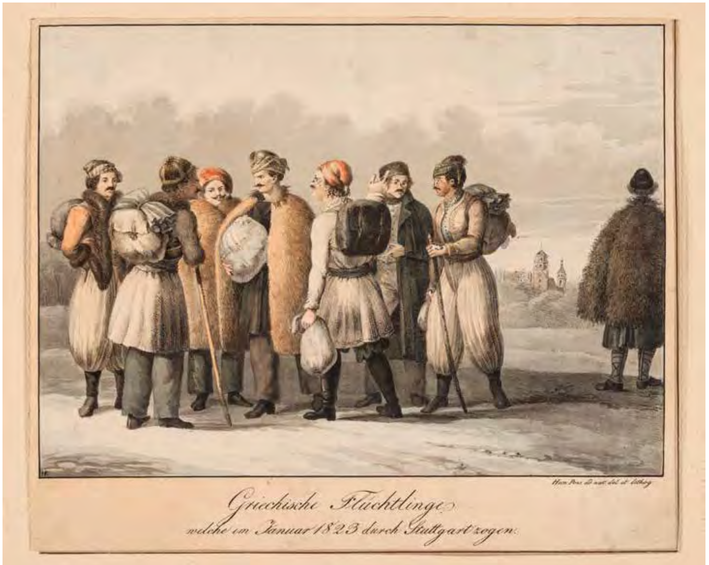
Έλληνες πρόσφυγες στη Στουτγάρδη το 1823

Από την ίδρυσή της, η ένωση της Στουτγάρδης δεν ήταν μόνο σε θέση να λειτουργήσει ως η κύρια ένωση για όλες τις τοπικές, υποκαταστήματα ή συγκεκριμένες ενώσεις της Βυρτεμβέργης, αλλά και ως οργανωτικό και συντονιστικό κέντρο βοήθειας για την Ελλάδα σε όλη τη νοτιοδυτική Γερμανία και μάλιστα για πολλά χρόνια.