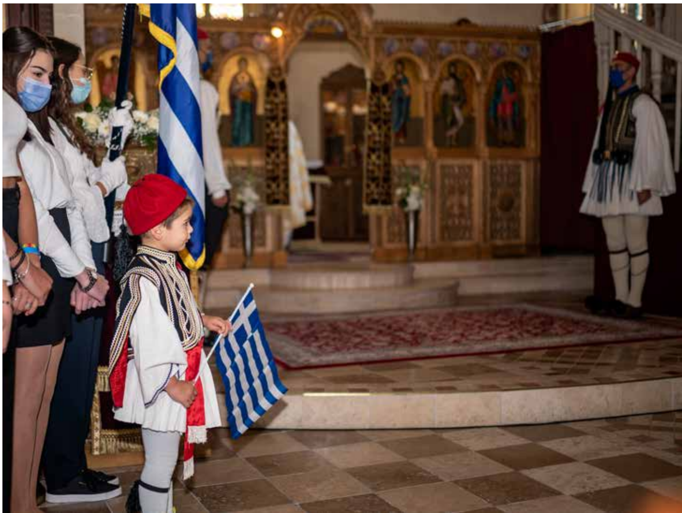
Ενορία Κωνσταντίνου και Ελένης Waiblingen