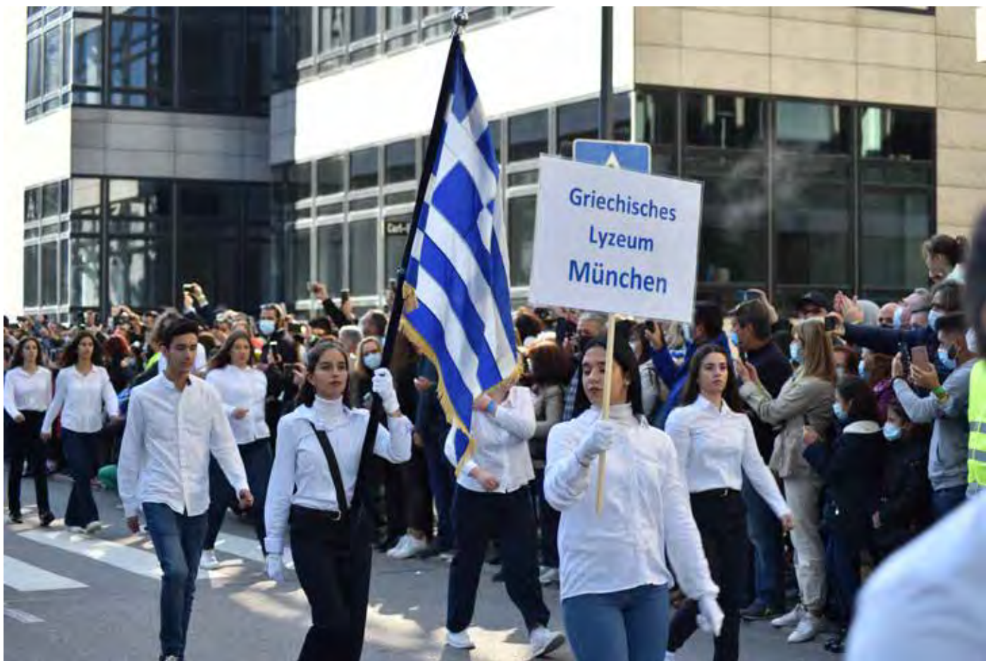
Παρέλαση Στουτγάρδης Σάββατο 9 Οκτωβρίου 2021