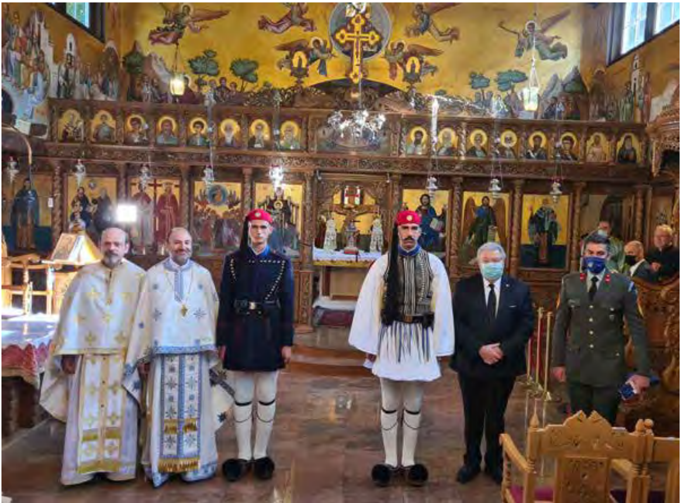
Ενορία Αναλήψεως του Σωτήρος Stuttgart-West

Την Κυριακή 10 Οκτωβρίου το Άγημα της Προεδρικής Φρουράς επισκέφθηκε 4 ενορίες στην ευρύτερη περιοχή της Στουτγάρδης όπου πραγματοποιήθηκαν Δοξολογίες και παρευρέθηκε πλήθος κόσμου. Η επίσημη Ορθόδοξη Εκκλησία της Γερμανίας ήταν στο πλευρό των διοργανωτών σε όλη την διάρκεια της προετοιμασίας και βοήθησε με όλους τους δυνατούς τρόπους την μεγάλη αυτή προσπάθεια.