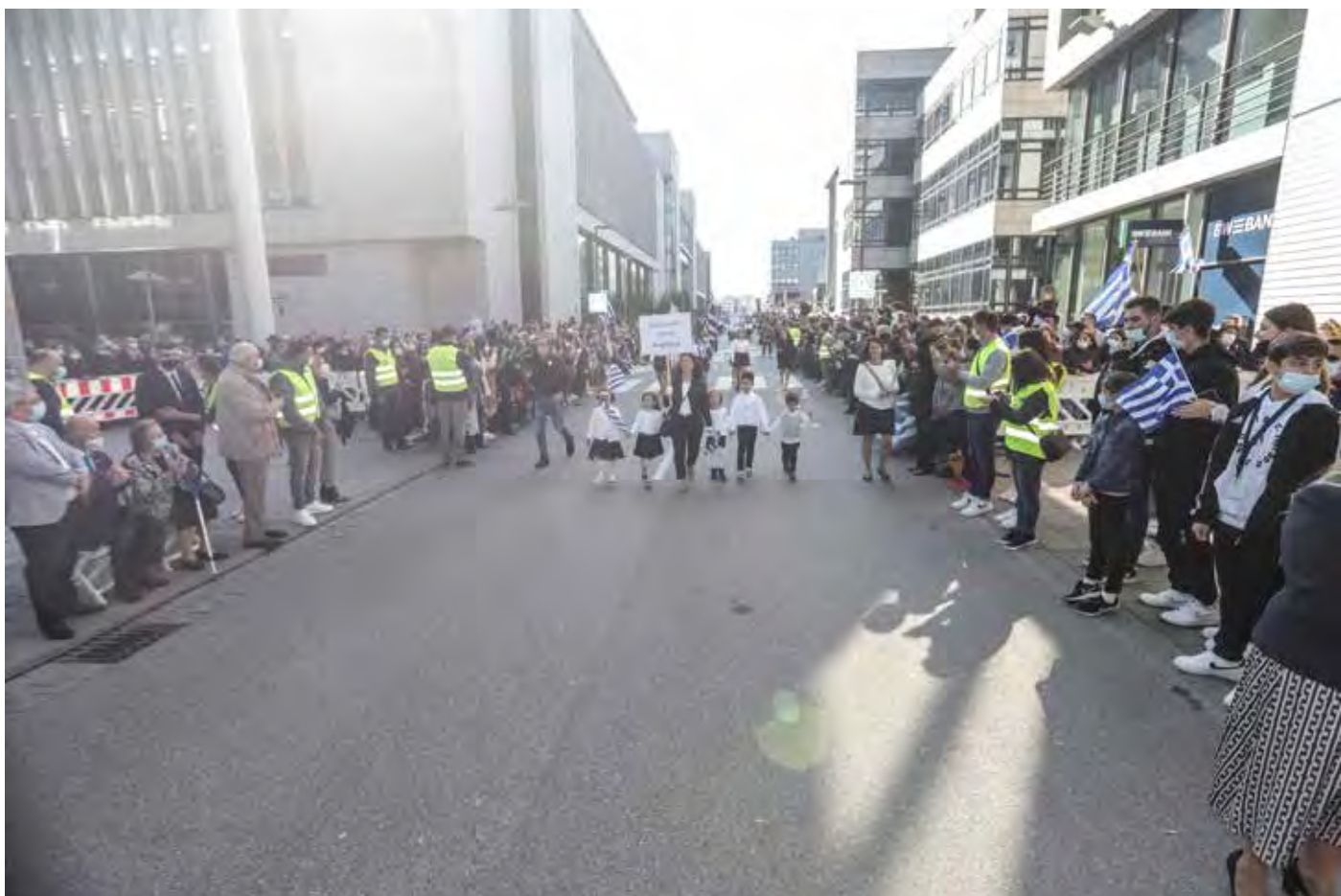
Παρέλαση Στουτγάρδης Σάββατο 9 Οκτωβρίου 2021