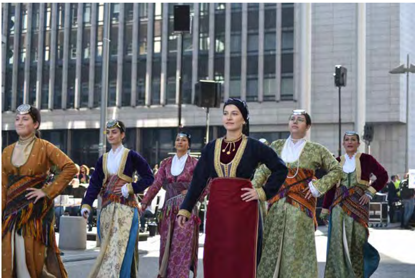
Παρέλαση Στουτγάρδης Σάββατο 9 Οκτωβρίου 2021