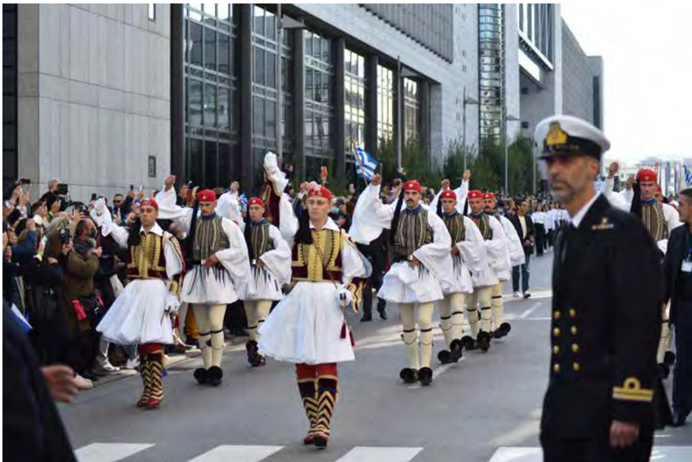
Παρέλαση Στουτγάρδης Σάββατο 9 Οκτωβρίου 2021