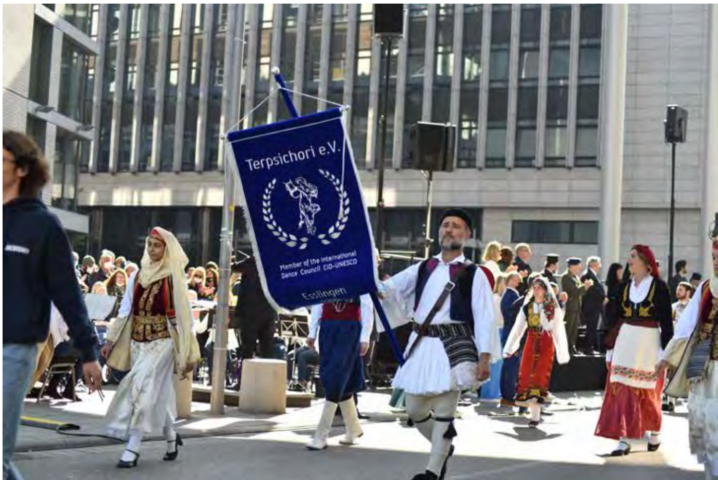
Παρέλαση Στουτγάρδης Σάββατο 9 Οκτωβρίου 2021