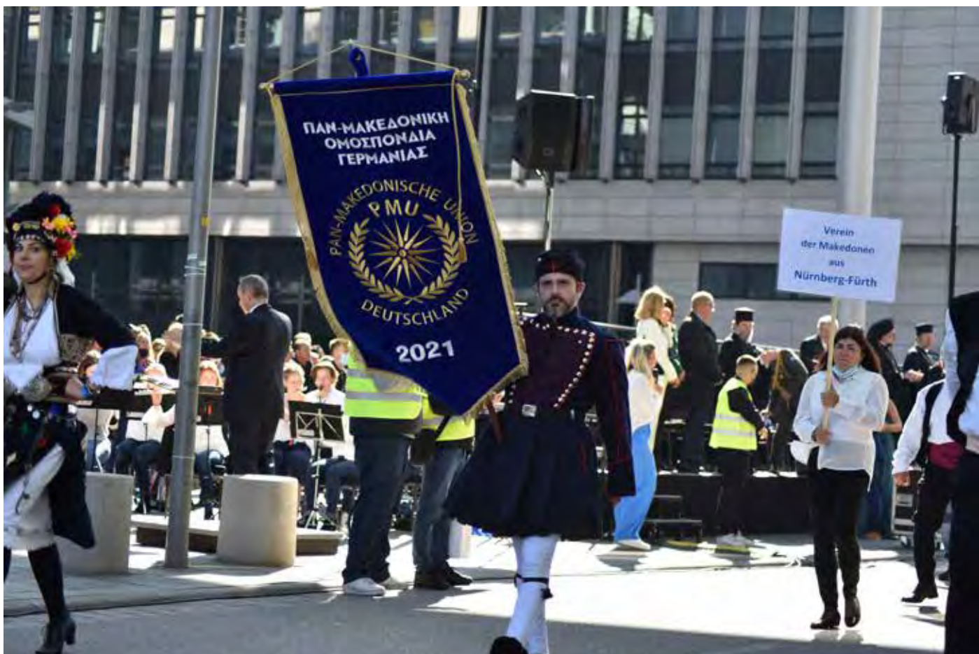
Παρέλαση Στουτγάρδης Σάββατο 9 Οκτωβρίου 2021