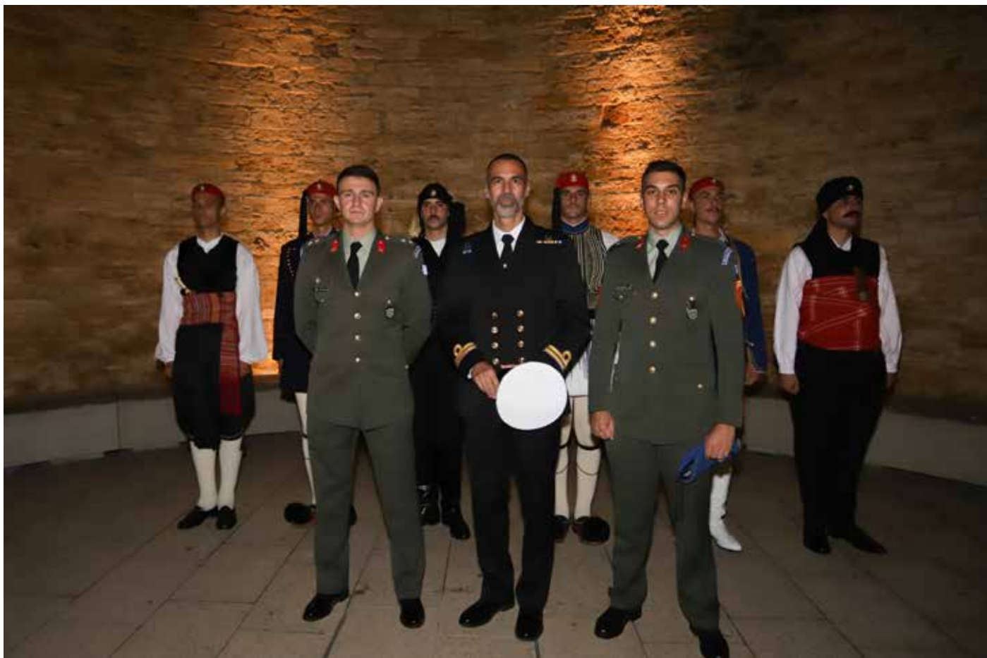
Βραδιά φιλελλήνων γερμάνων Kursaal Bad Cannstatt - Stuttgart