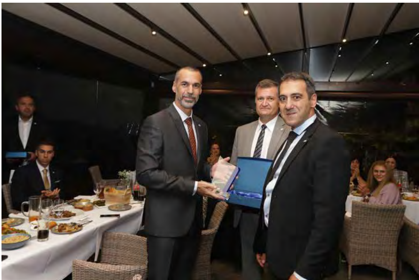
Ανταλλαγή αναμνηστικών δώρων της οργανωτικής επιτροπής με την Προεδρική Φρουρά