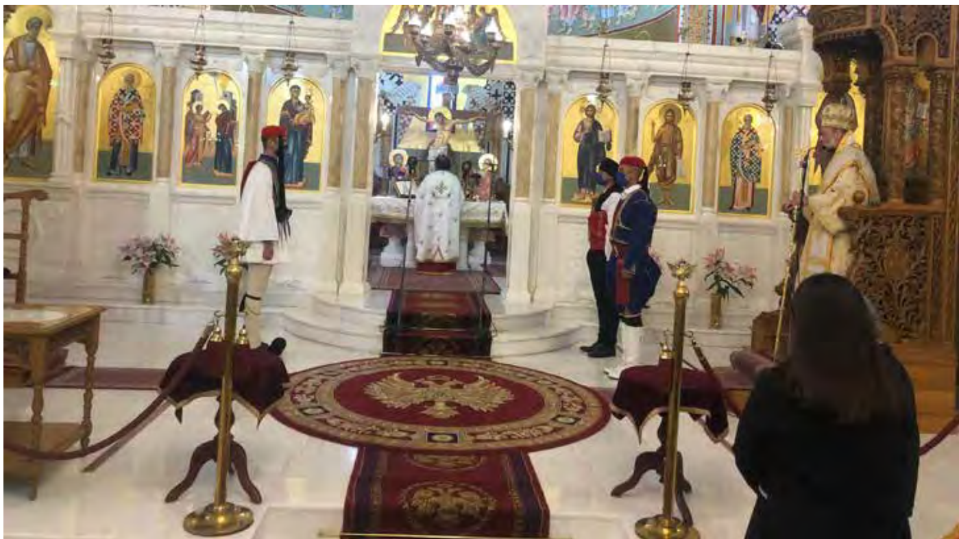
Ενορία Ευαγγελισμού της Θεοτόκου Esslingen