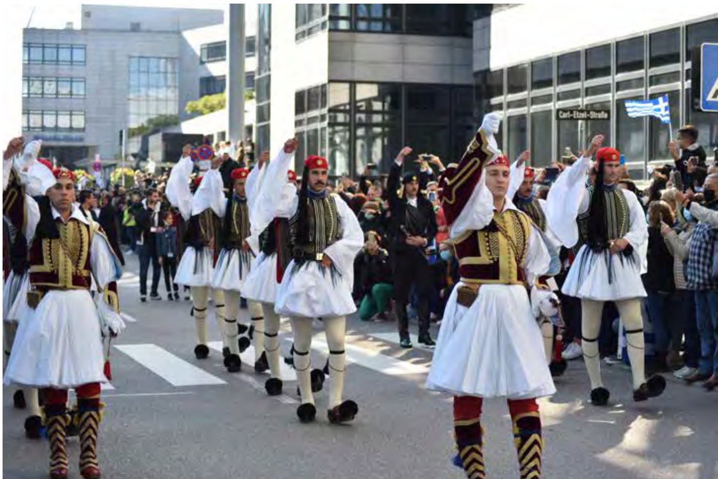
Παρέλαση Στουτγάρδης Σάββατο 9 Οκτωβρίου 2021